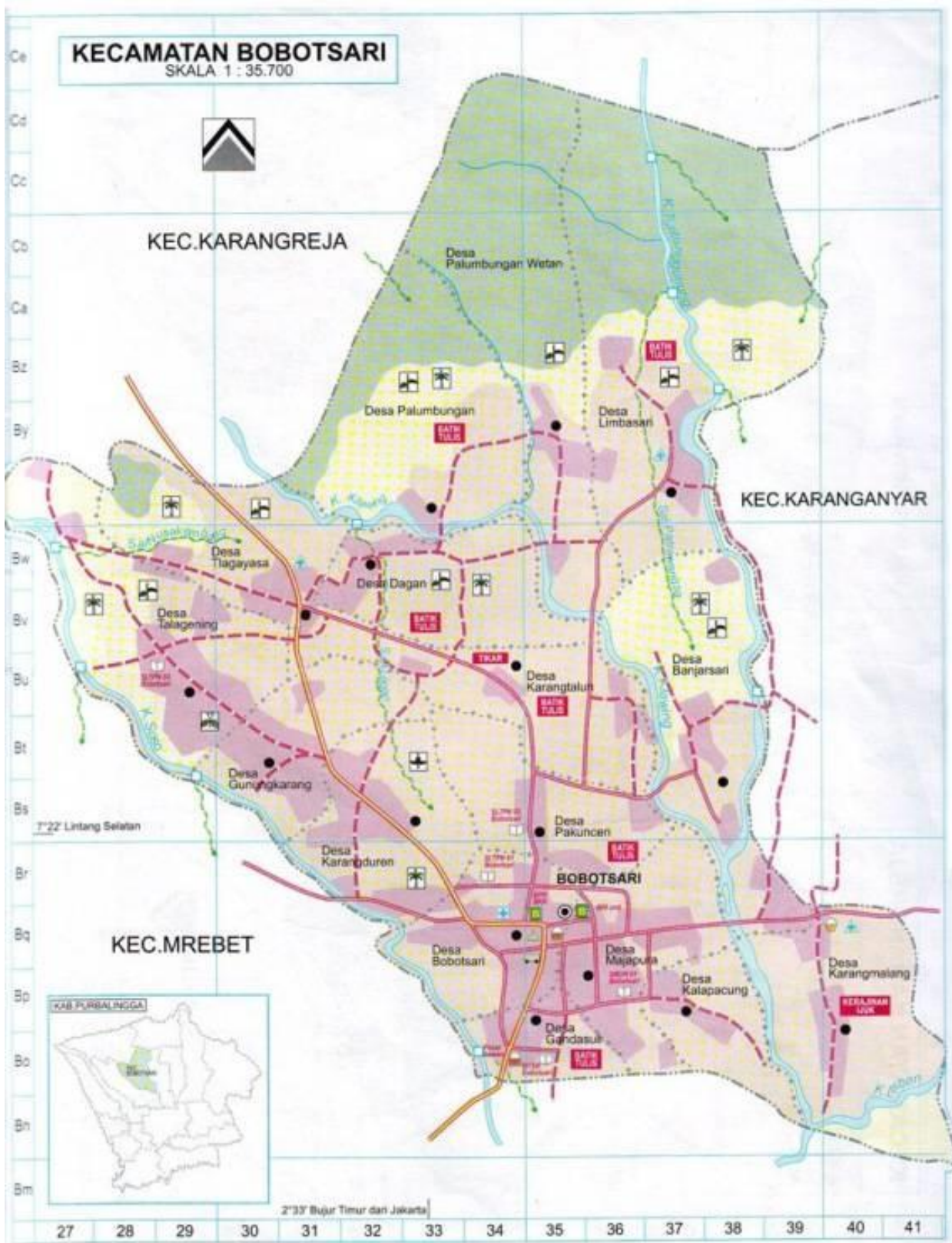
Gambar : 1 Peta Wilayah Kecamatan Bobotsari